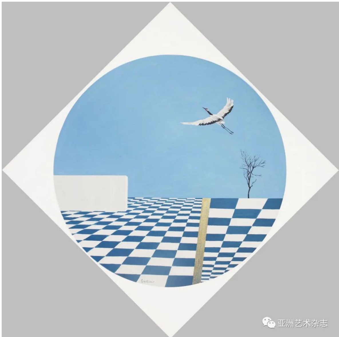
《局部范围·鹤》100x100cm 布面油画 2017 年

Local scope series continue to use the visual elements of the previous creative series, the layout mostly take the form of "circle", the picture order is more rational. Li Xubin "multum in parvo", "look at a leopard through a tube", with a more calm, more objective state through the local scope of the description, to