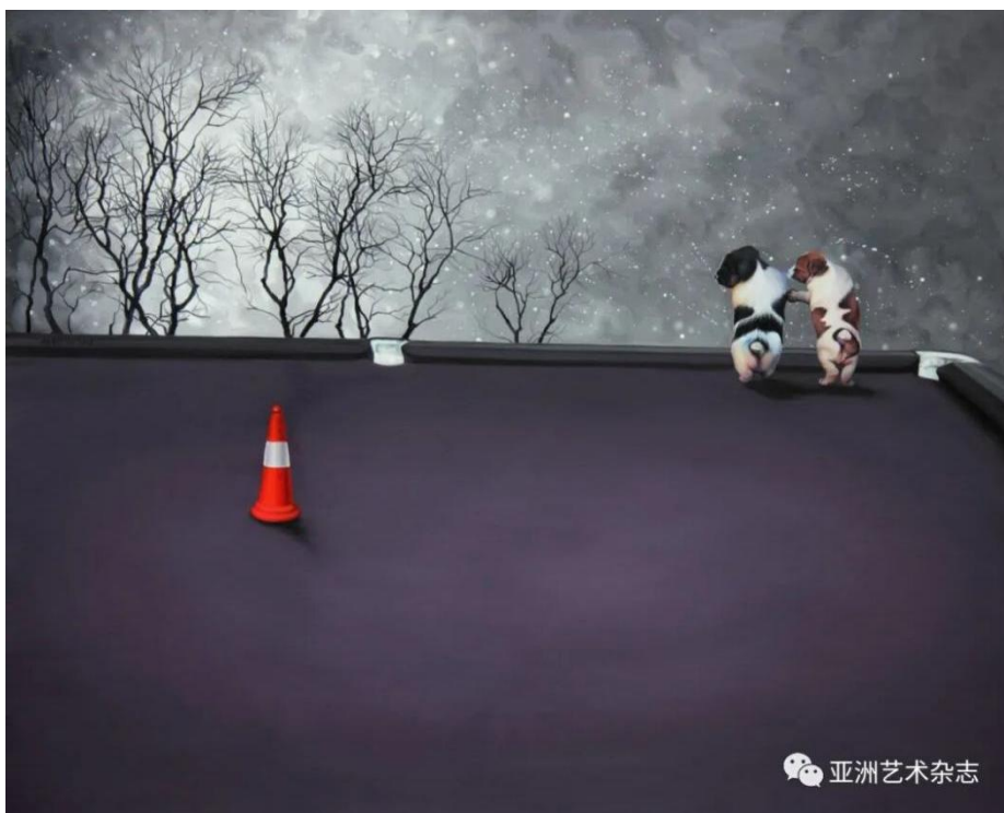
《35 度角的风景》150x120cm 布面油画 2013