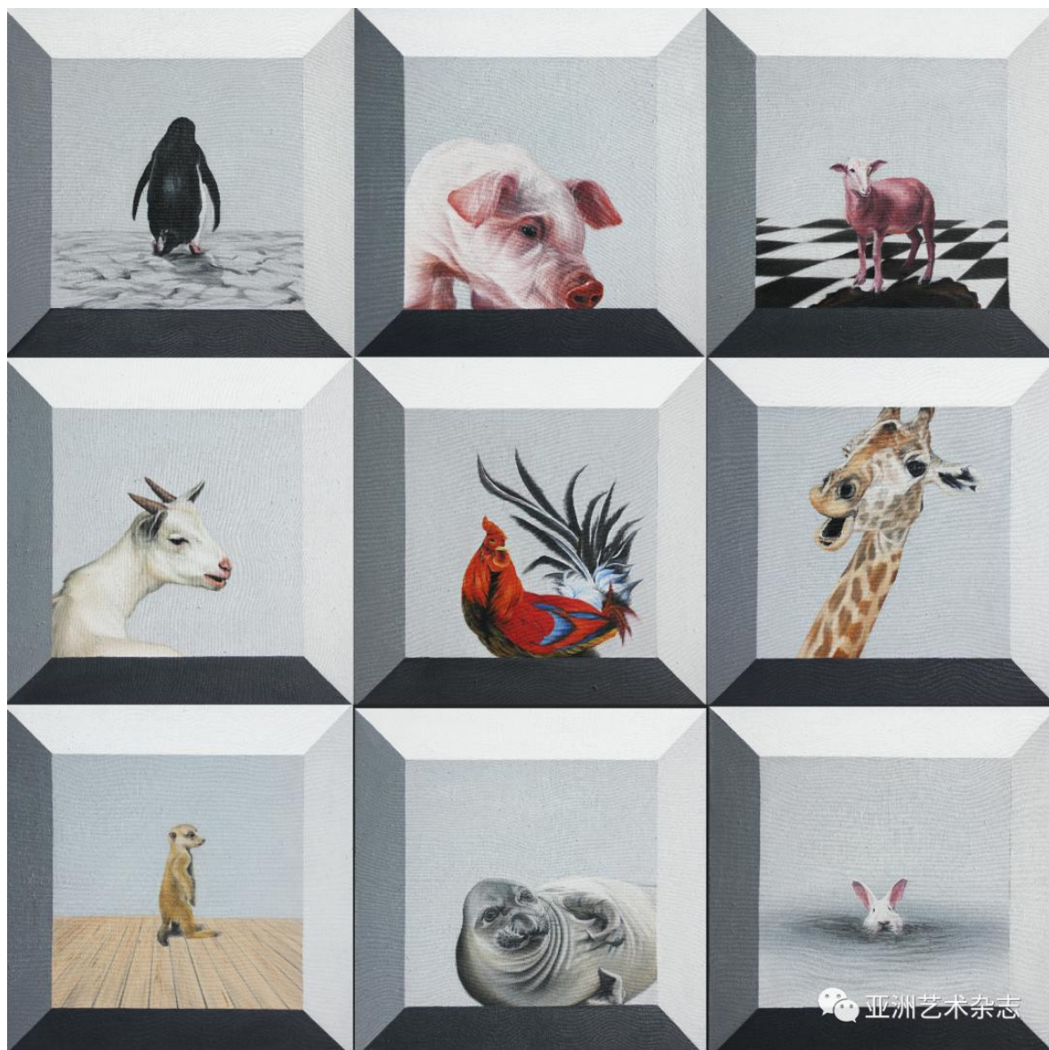
《看过来》 120x120cm 布面油画 2016

Relating to My Memory series works can be regarded as Li Xubin's art creation exploration stage, that is, trying to combine life experience with art language and style. In this series, Li Xubin put the game scenes, animals and other elements representing childhood memories on the cloud, with obvious stream of