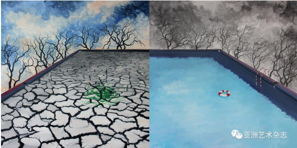
《失乐游》100x200cm 二联 布面油画 2014

The 2009 Great Scenery, Where to Go series, is the artist's natural description through intense external stimulation. As we all know, the 2008 Wenchuan earthquake and financial crisis, the ruins after the disaster, the scene of ruins, led Li Xubin to rethink the relationship between "self" and "other". Great Scenery and Where to Go depict the artist's reflection on man and city, man and nature, man and disaster. His dramatic combination of elements such as urban landmarks and disastrous scenes, and his complicated background processing, presents a magnificent apocalyptic landscape with some prophetic nature, the question of where to go, with the philosophical significance of metaphysics. Li Xubin has gone from thinking about the life experience of "I", to worrying about the future nature of human civilization community and the