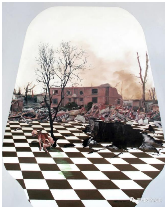
《都市里阳光灿烂--淡绿》160x200cm 布面油画 2011

当李旭彬进入更广阔的叙事语境后，开始深入思考日常与自我之间的关系，于是创作了《都市里阳光灿烂》系列。此系列不再描绘全景式的视觉解构，而是通过细节性的、片段式的描绘，不以悲观的、消极的，也不以粉饰的、积极的心态去创作，而是以艺术家自认为的客观性去诉说，有点类似于电影艺术中的旁白。代表欲望的火山喷发、龟裂的大地、完整的或者黑洞化的马赛克地板、一隅的墙壁与各种姿态的动物形象并置，完全抽离了“人”的形象的存在。