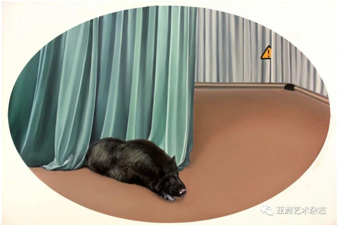
《家之豕》120x80cm 布面油画 2019 年