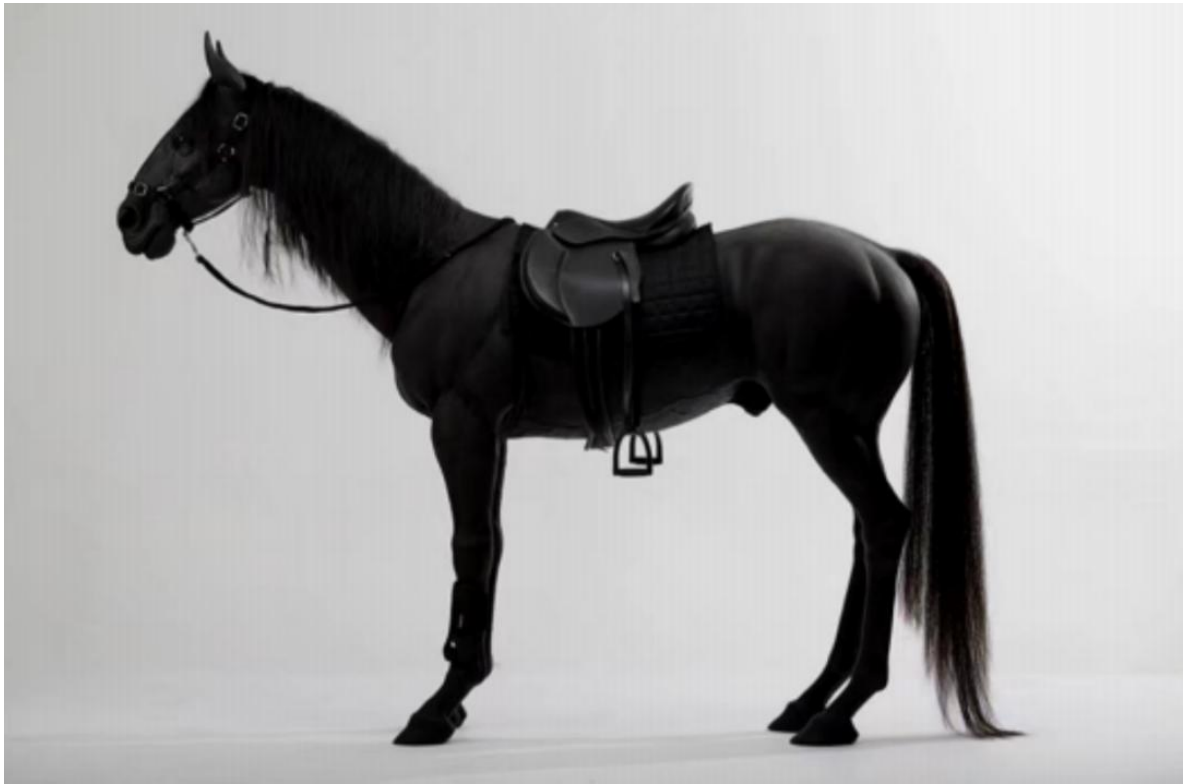
黄成, 《If I were you》, 硅胶, 270 x220x70cm, 2014