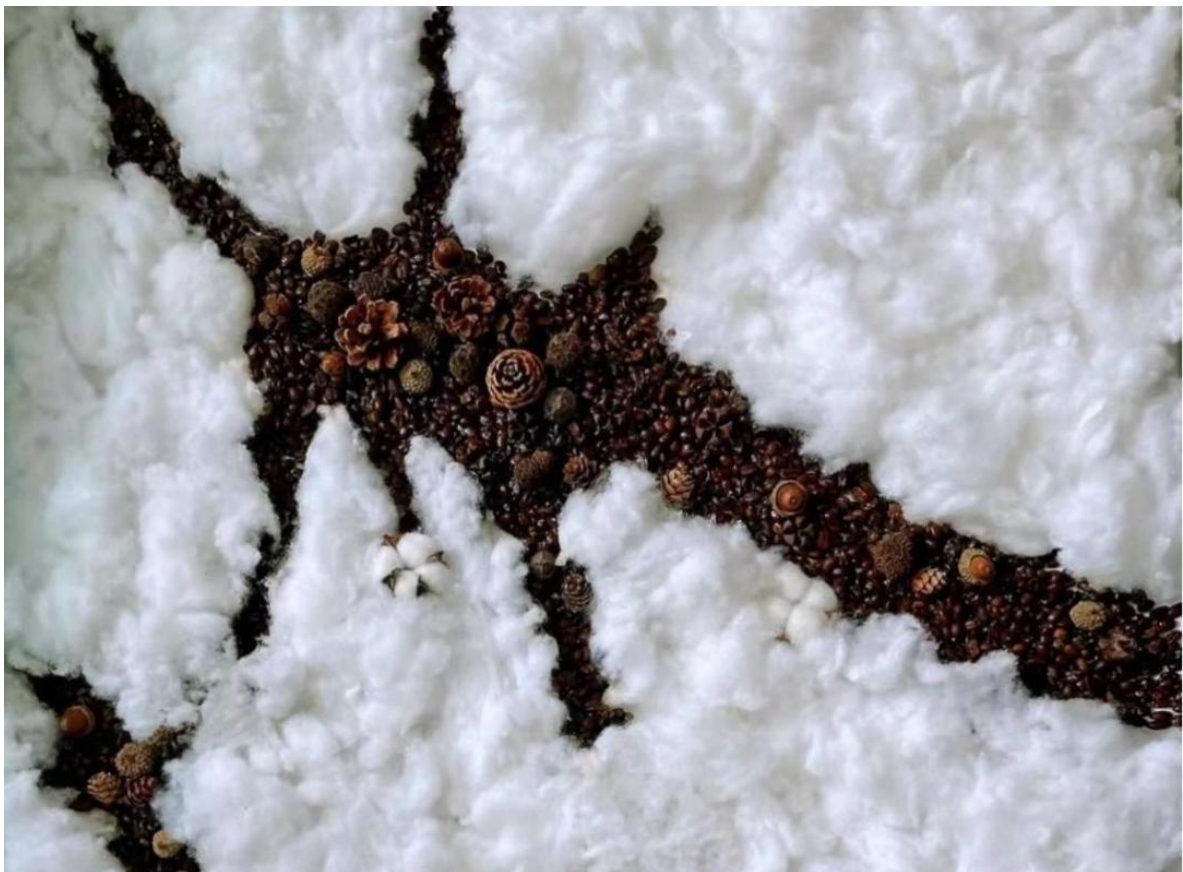
Masha Rom, 《praise of life》, 综合材料, 100x80cm