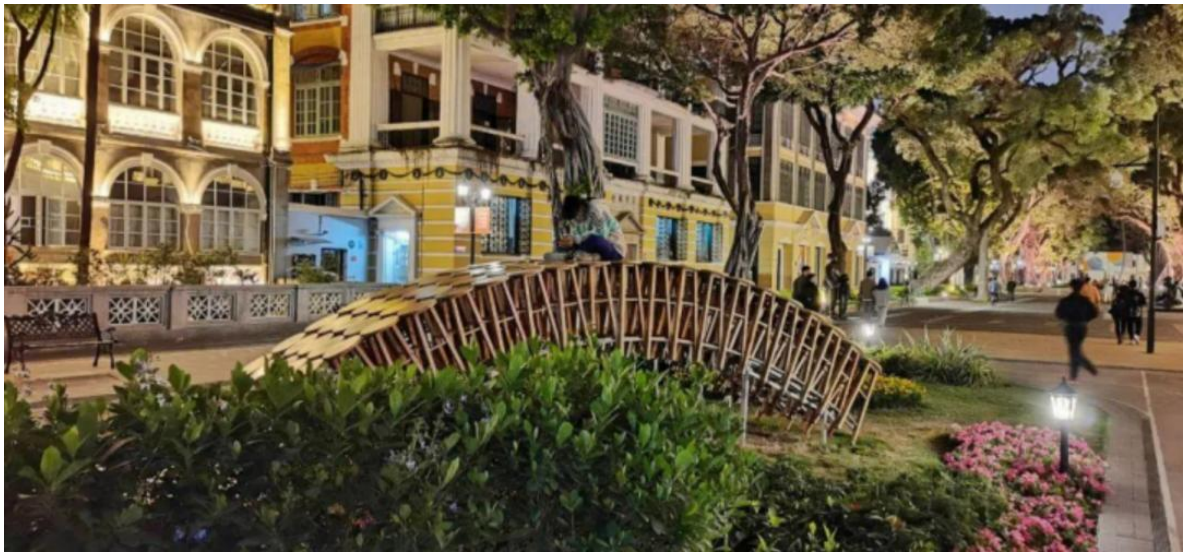
杨义飞, 《个体/集体》, 综合材料, 600x140x150cm