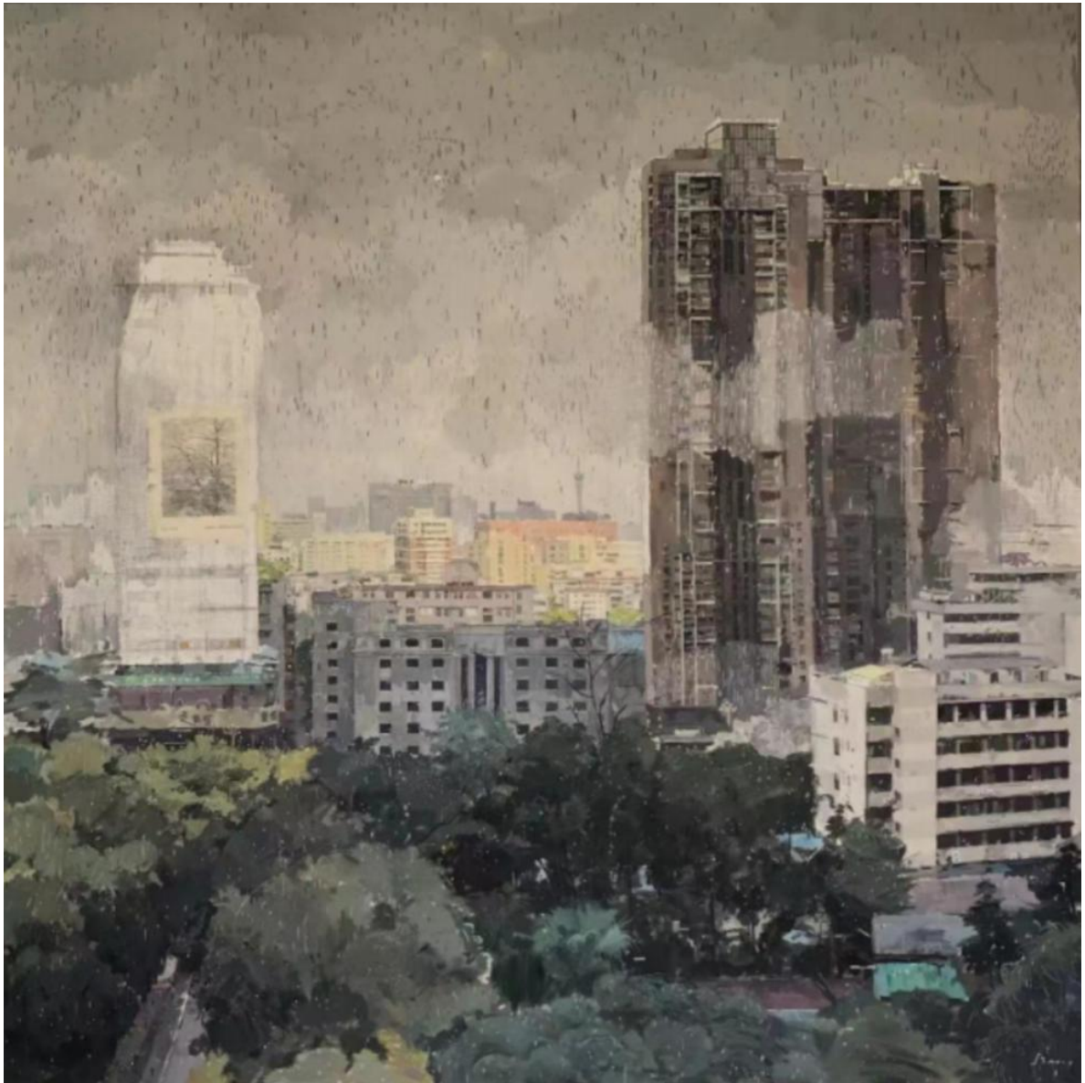
党零星，《从身语意之所生》，油画，150x150cm，2017