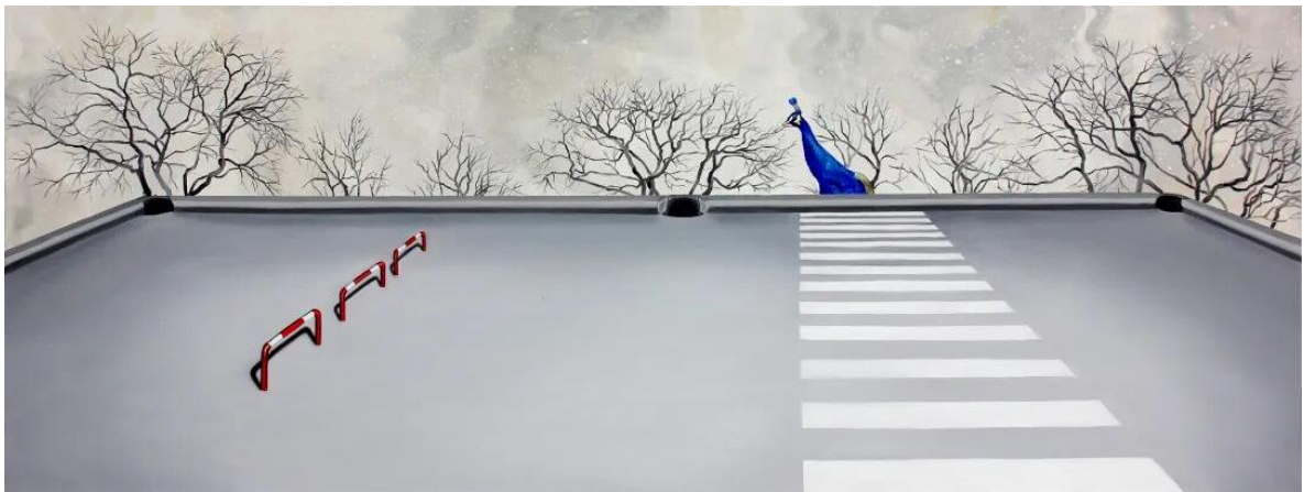
李旭彬，《没有尽头的承诺》，布面油画，160x60cm，2017