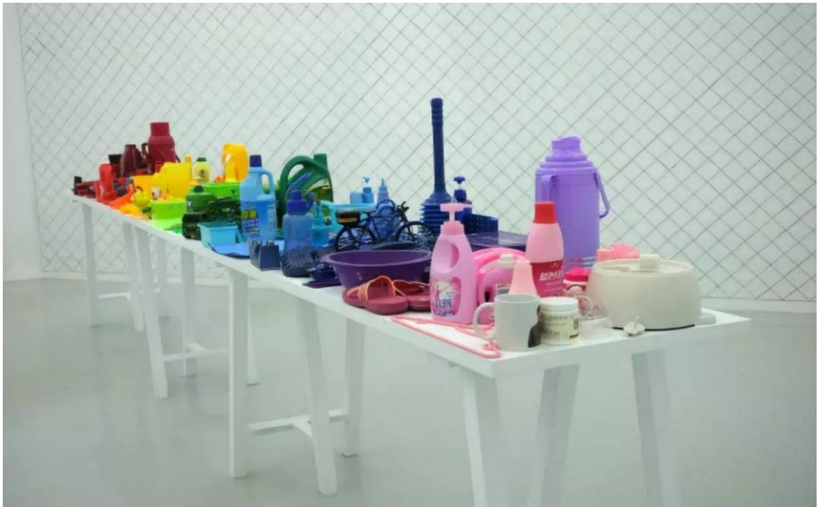
李景湖，《彩虹》，装置，废旧用品，尺寸可变，2009