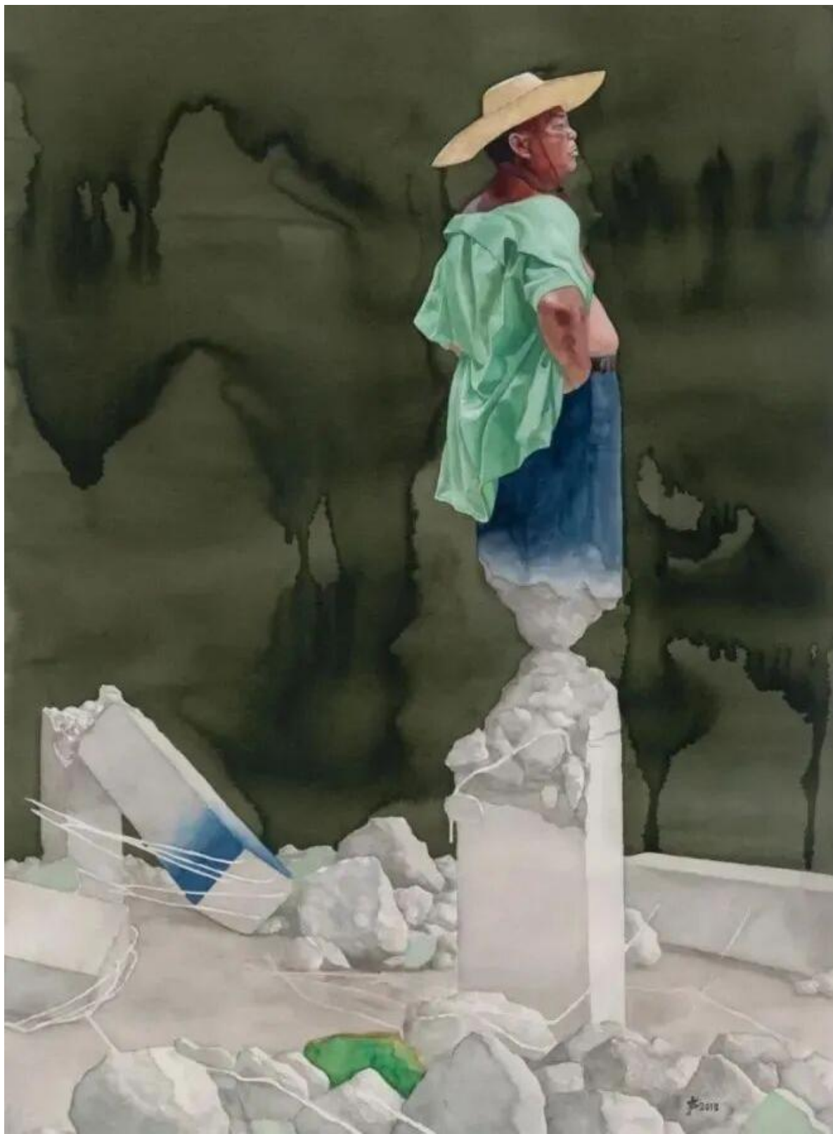
刘声，西三（29），纸本水彩，79x110cm，2018