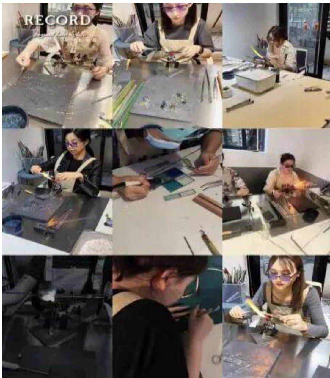
图 6： 非遗琉璃灯工艺教学实况