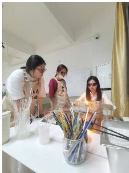
图 4：校内琉璃灯工工艺活动推广