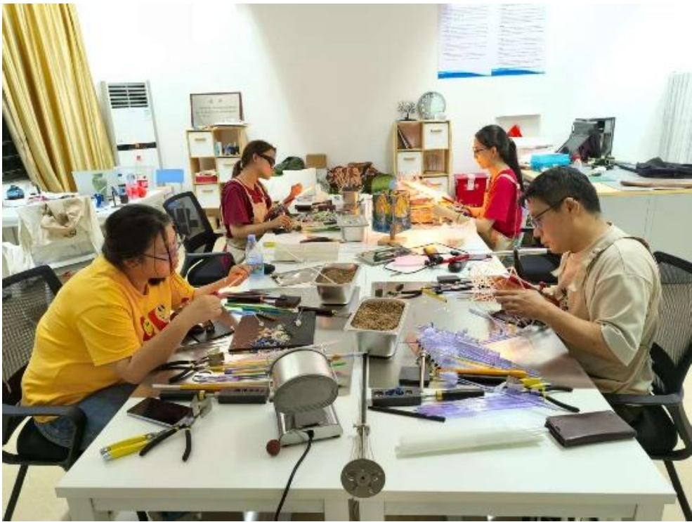
图 5： 非遗琉璃灯工工艺校内推广