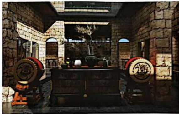
《传统风貌建筑生态修复设计——玄关 中景》