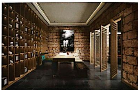
《传统风貌建筑生态修复设计——包间》