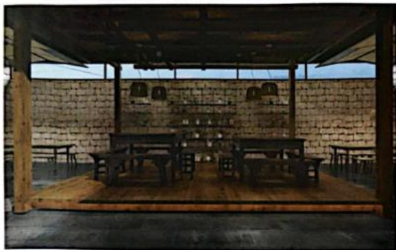
《传统风貌建筑生态修复设计——中堂》