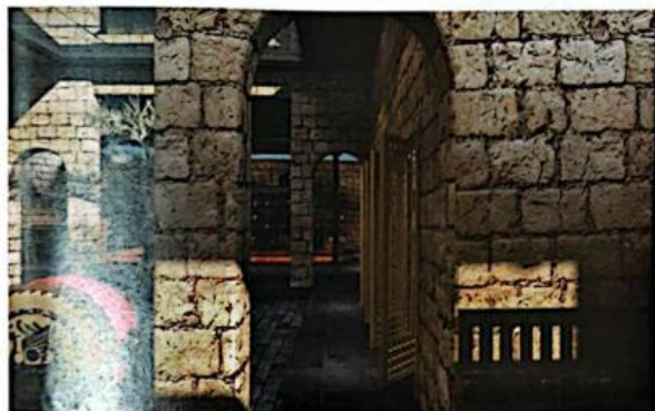
《传统风貌建筑生态修复设计——走廊》