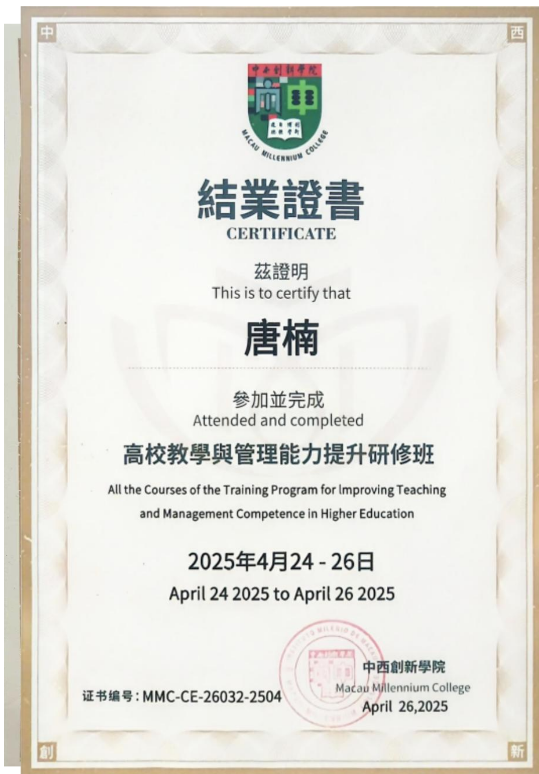
图 10: 2025 年 4 月高校教学与管理能力提升研修班-澳门中西创新学院证书