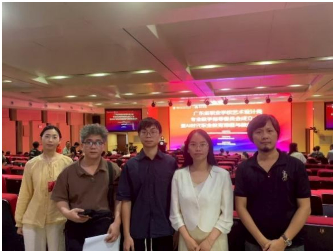
图 6：广东省职业学校艺术设计类专业教学指导委员会成立大会