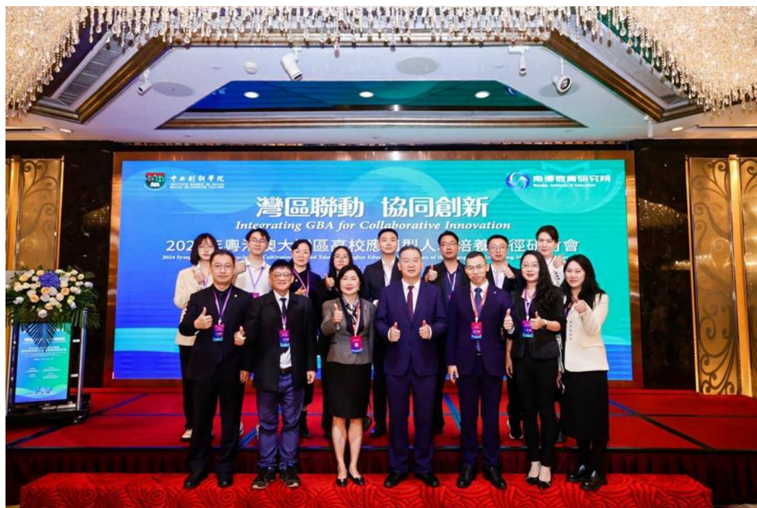
图 2：2024 年粤港澳大湾区高校应用型人才培养路径研讨会