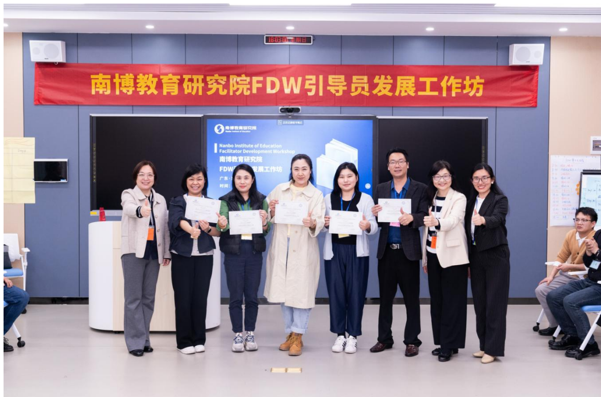
图 13：南博教育研究院 FDW 引导员发展工作坊