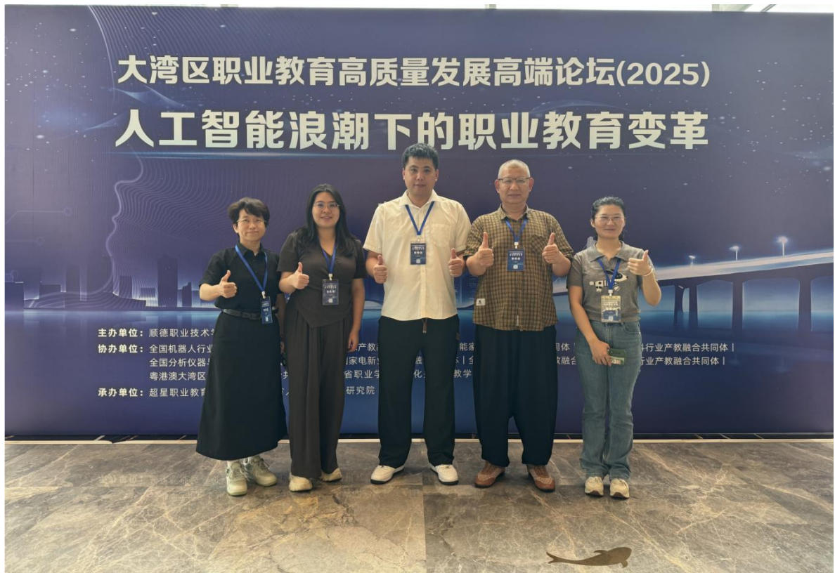
图 12：2025 年 6 月人工智能浪潮下的职业教育变革