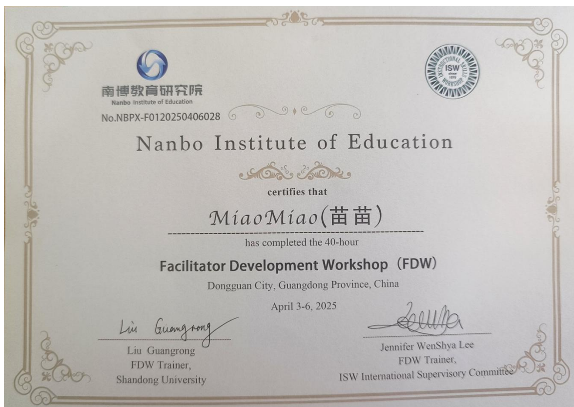
图 14：南博教育研究院 FDW 引导员发展工作坊证书