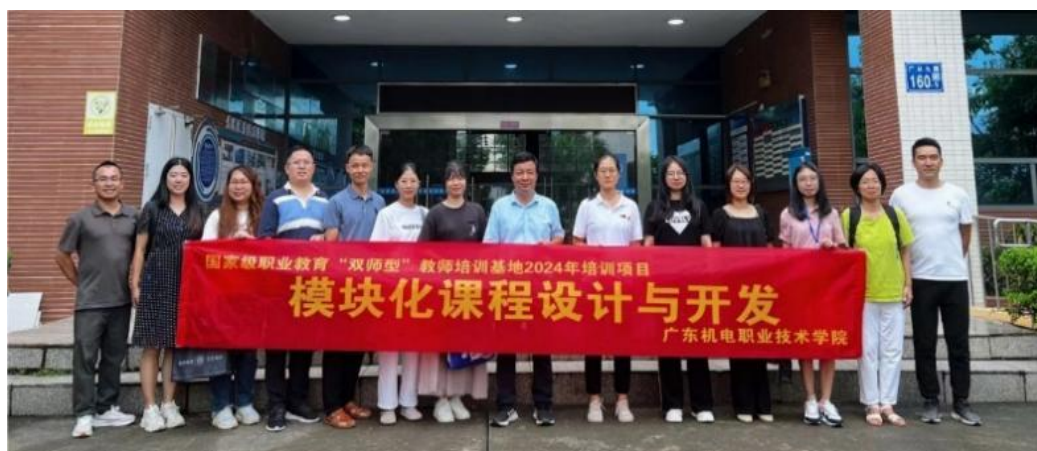
图 4：2024 年教师参加国家职业教育“双师型”《模块化课程设计与开发》培训项目