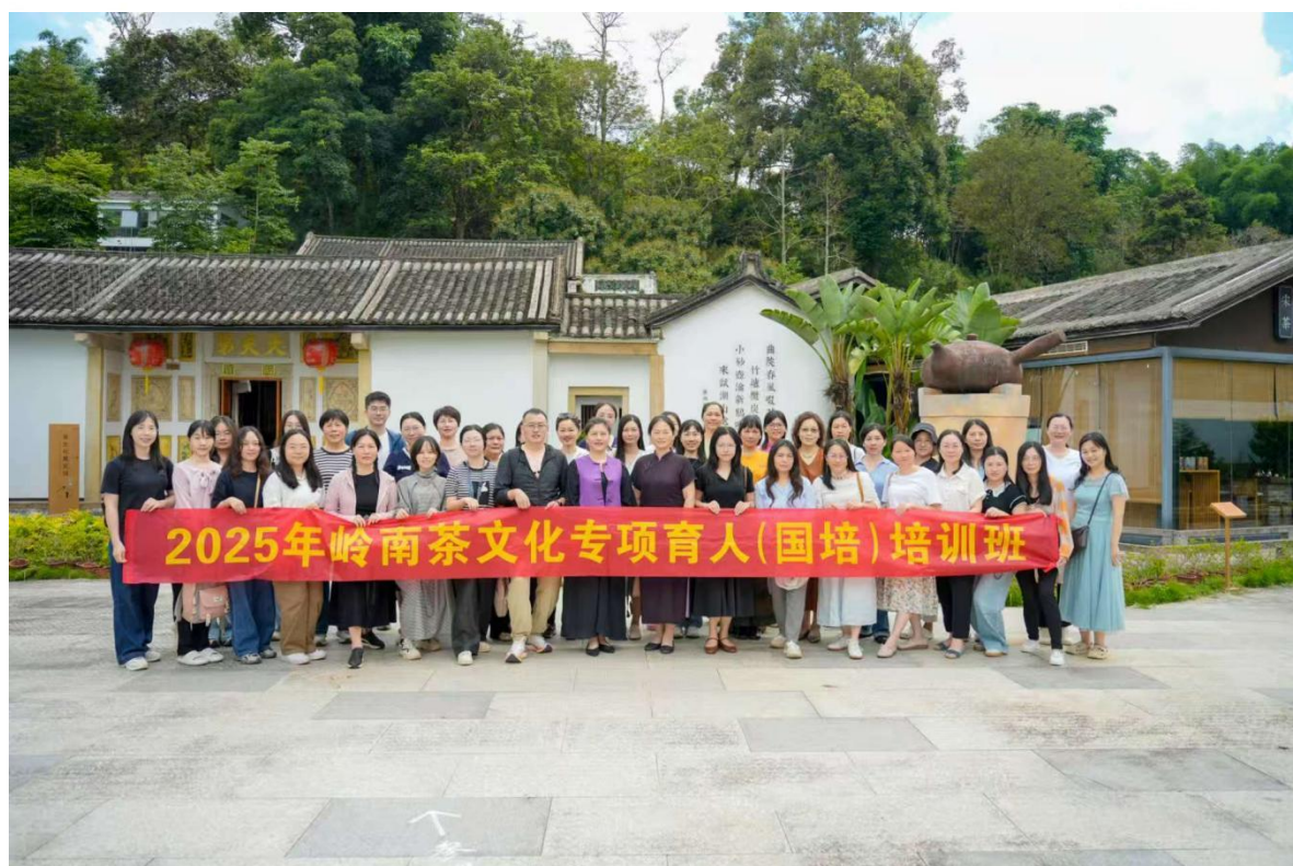
图 7: 2025 年岭南茶文化专项育人(国培)