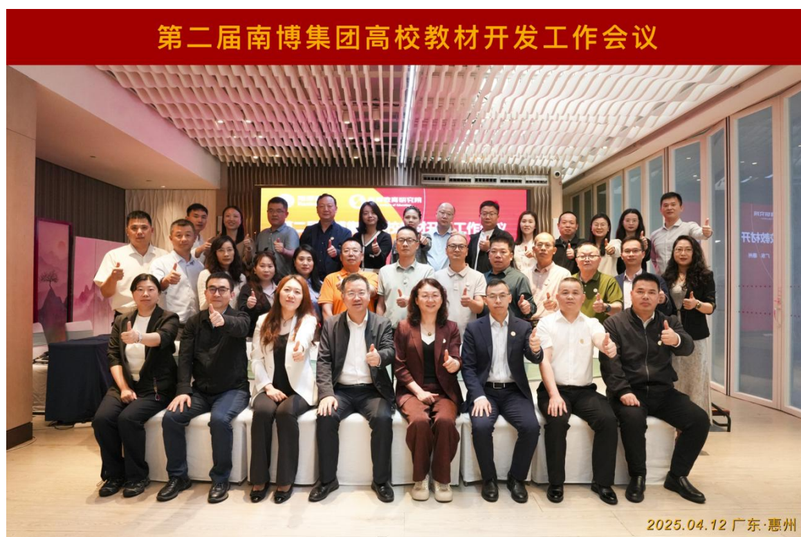
图 15：南博教育研究院 FDW 引导员发展工作坊