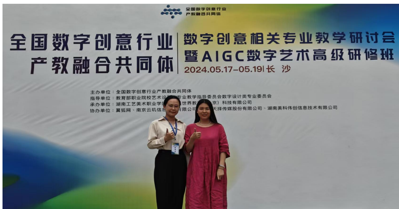
图 1：长沙数字化 AIGC 创意培训