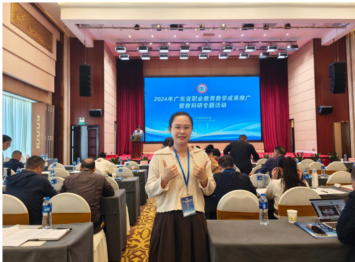
图 16：全省青年教师教学大赛现场决赛活动