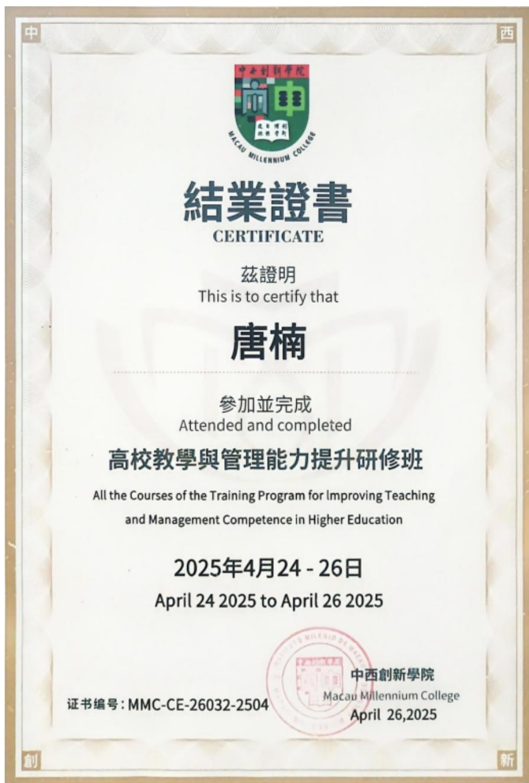
图 9：2025 年 4 月高校教学与管理能力提升研修班-澳门中西创新学院证书