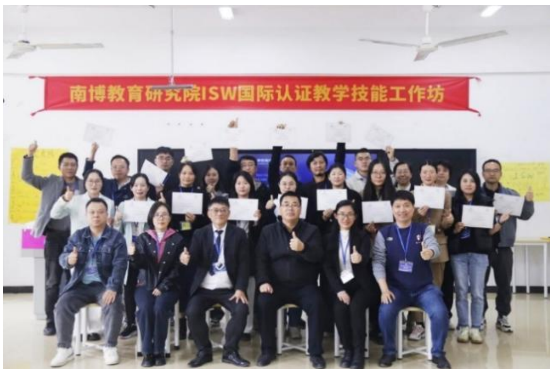
图 5：新时代视传设计 AI 设计应用企业实战培训